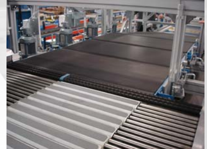
❑ Verteiler v. Aufgabe