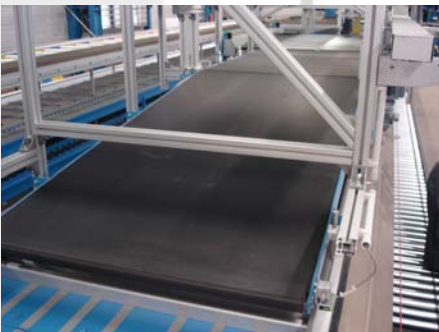
❑ Automatische Aufgabe