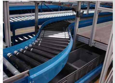
❑ Fördertechnik für Abtransport