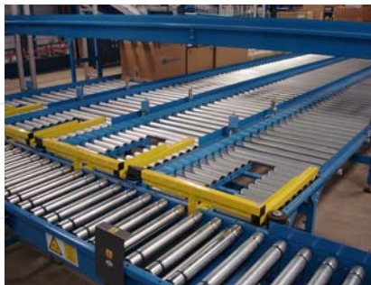
❑ Verteilung auf Touren