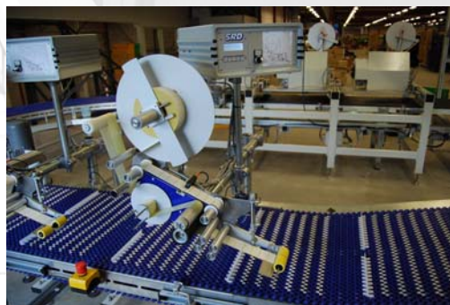
Automatische labeling unit